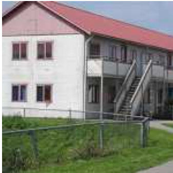
Dit is een asielzoekerscentrum. Hier wonen de mensen zolang hun asielaanvraag nog loopt.

Sommige mensen mogen niet in Nederland wonen maar doen dit stiekem. Deze mensen noem je illegalen . Zij wonen in Nederland terwijl de regering gezegd heeft dat ze hier niet mogen wonen, bijvoorbeeld omdat het land waar ze eerst woonden veilig is, of omdat deze mensen hier komen om een beter leven te krijgen. Illegalen worden ook weggestuurd.