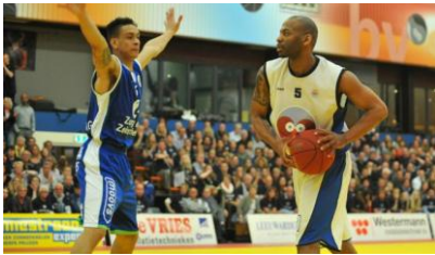
De verdediger( armen wijd) tegenover de aanvaller.