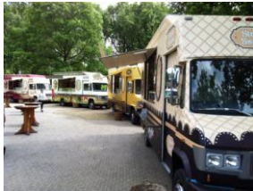
Een karavaan Fastfood wagens in de Efteling