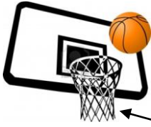
← De basket