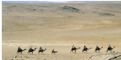
Een karavaan in de woestijn in Egypte